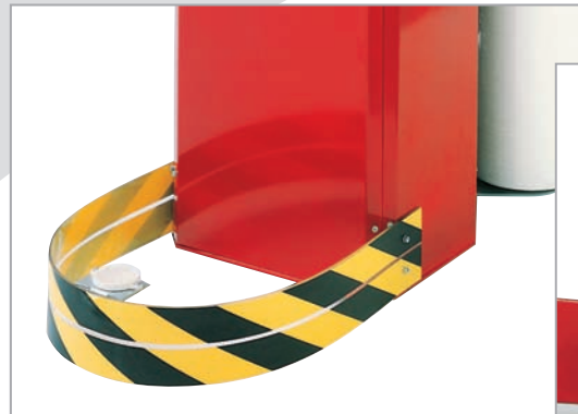
Dispositivo di sicurezza per arresto immediato del braccio rotante